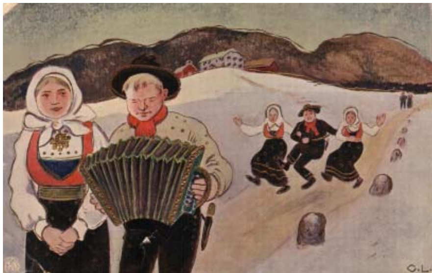
Gammelt postkort