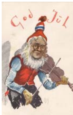
Gamalt postkort

Korleis er det med deg? Bed du inn til julelag? Syner du omtanke for familie, vener, arbeidsfolk og andre?