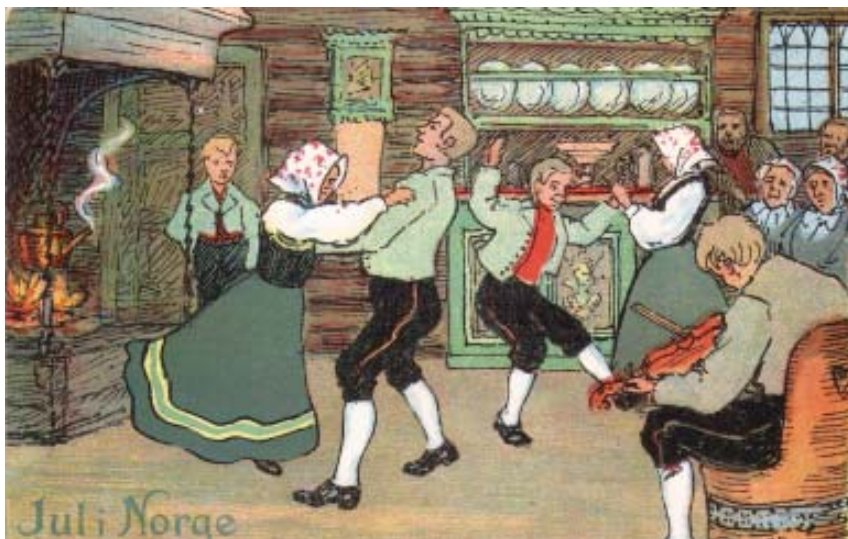
Gamalt postkort

Låt o link seier seg hjartans einig med jubilant Magny og ynskjer henne lukke til med prisen!